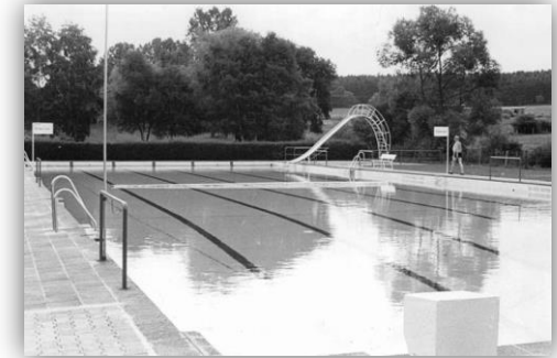
„Ludwig-Bender-Bad“ in früheren Zeiten